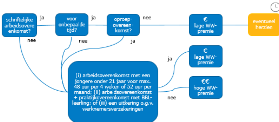
Figuur 1: hoge/lage WW-premie